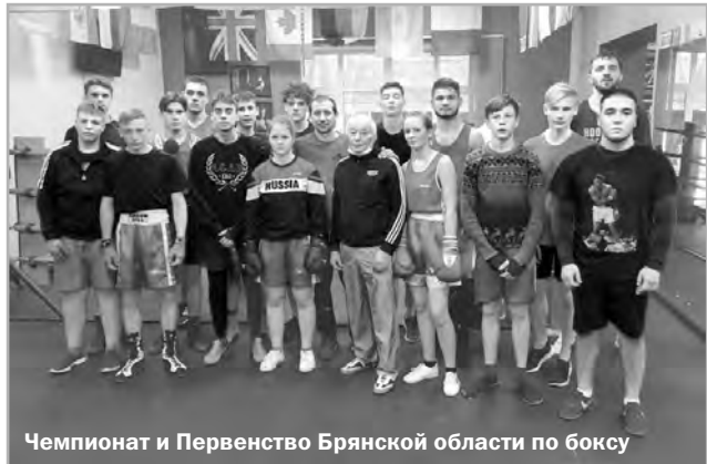
Чемпионат и Первенство Брянской области по боксу