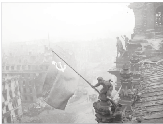
С праздником! С днём Великой Победы!

Дорогие ветераны Великой Отечественной войны, труженики тыла, вдовы и дети войны! Исторический масштаб и значение вашего подвига неподвластны времени. Вы не только защитили страну, но и возродили ее, подарив нам мирное небо и уверенность в завтрашнем дне. Ваши идеалы добра, справедливости и любви к Родине сегодня вдохновляют нас на созидательный труд во имя процветания России. От всей души желаем вам здоровья и долголетия, пусть каждый ваш день будет окружен заботой и вниманием. Мы всегда будем гордиться вами, равняться на вас, на поколение победителей!